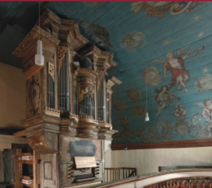
Wender-Orgel in der St.-Georg-Kirche Dörna