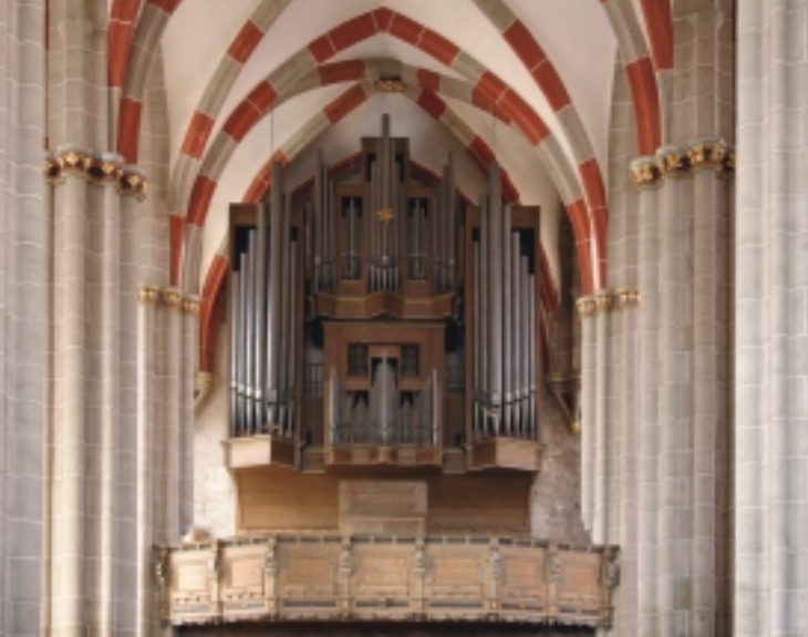
Schuke-Orgel in der Divi-Blasii-Kirche Mühlhausen